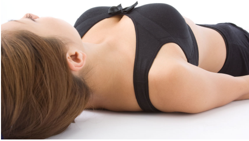
(ワンダーボム スリープアップブラ着用時)

①2枚生地でサイドバスの横流れをストップ！ サイドパネル 脇肉はスッキリ、バストはふっくらボリュームを目指します！ 肌あたりがソフトな綿天竺