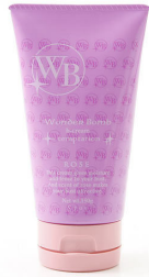
ワンダーボム ビークリーム テンプテーション 冬季限定商品 150 g 3,990 円(税込)