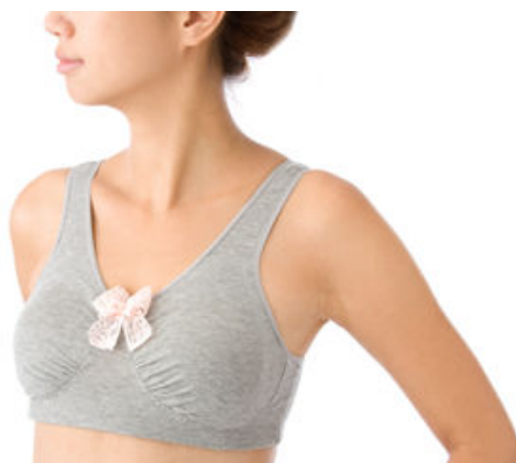
グレー×ピンクリボン