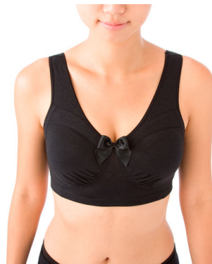
(ワンダーボム スリープアップブラ着用時)