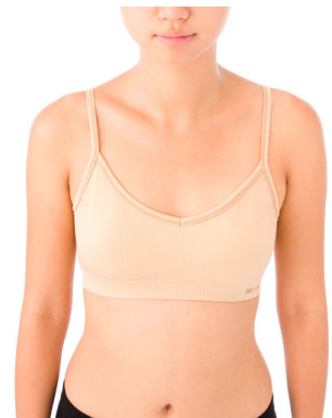
(他社リラックスブラ着用時)