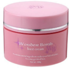
ワンダーボム 通年レギュラー商品 100g 3,675 円(税込)

グラビアアイドル松金ようこさんとコラボし、芸能界でも多くの方に愛用いただいている話題のバストケア。ネットを皮切りに、店頭、紙通販、テレビ通販に登場。①ハリ ②弾力 ③ボリューム を考えたアイテムを提唱。顔と同様にバストの下垂など年齢を感じたり、若くてもボリュームに悩む女性の気持ちを考えたバストケアシリーズ。